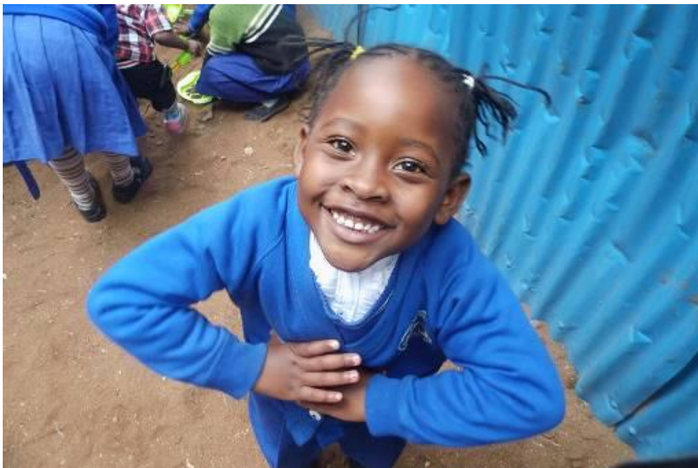
En hier word je blij van!

Ook zijn er studenten in Kenia actief op de school. Zij komen als voorbeeld op de school om te laten zien aan deze kinderen dat je los van je achtergrond dat kunt bereiken dat je graag wilt als je hard werkt. Heel mooi om te zien!