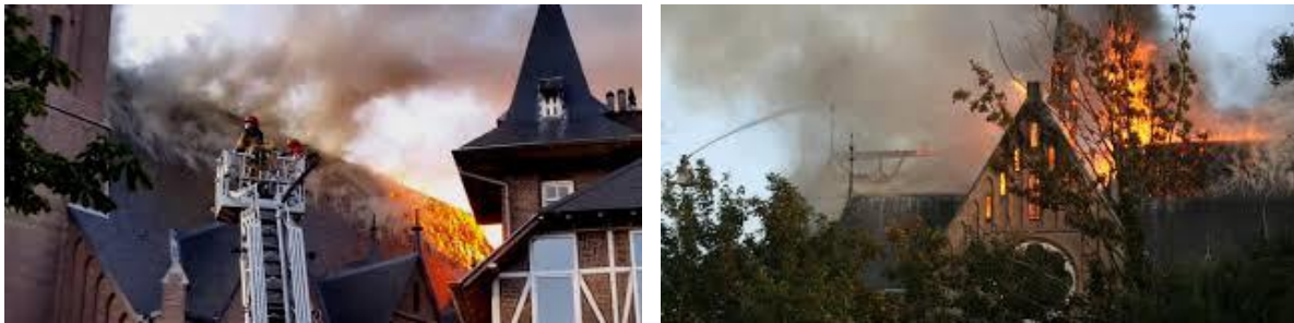
Brand kerk – pand rechts op foto links is ons kantoor

Deze Newsflash publiceren we later dan gepland, omdat we de afgelopen weken zijn afgeleid door een aantal onverwachte situaties. Deze vielen uiteindelijk of mee en/of we hebben ze weer de positieve kant op kunnen sturen, maar wel zaken die onze aandacht nodig hadden. In het weekend van 15 september heeft er een grote brand plaatsgevonden in de Urbanus kerk in Amstelveen. Het kantoorpand van SCM Executives (en daarmee ook ons kantoor) is bevestigd aan deze kerk. Het hele weekend hebben we in spanning gezeten of al onze spullen zouden zijn verwoest (dan wel door brand dan wel door waterschade). Gelukkig bleek het pand, op de kelder na, volledig onbeschadigd. Wat een geluk voor ons. De kerk heeft helaas wel grote schade opgelopen. Vanuit ons raam kijken we nu op de ruïnes van de kerk, op 3 meter afstand, heel bijzonder.