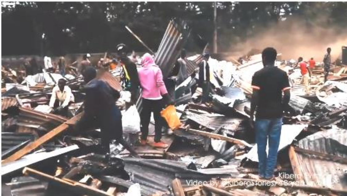
Mensen op zoek tussen wat er over is van hun woningen.

Omdat het in de buurt van de Akili School is gebeurd, heeft de school ook veel leerlingen verloren, die nu hopelijk elders naar school kunnen gaan.