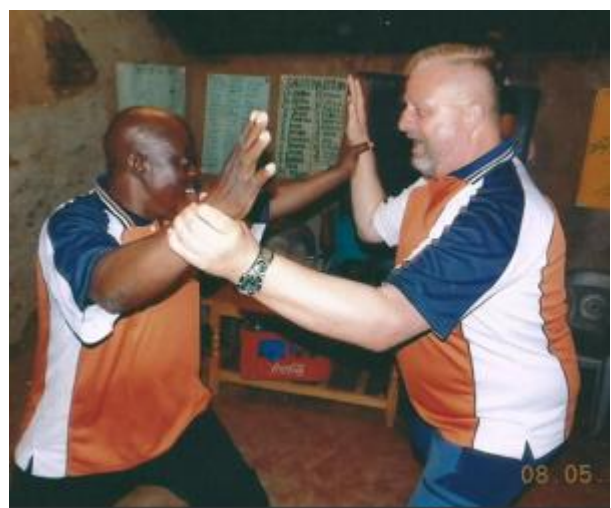
Rots en Water in de praktijk