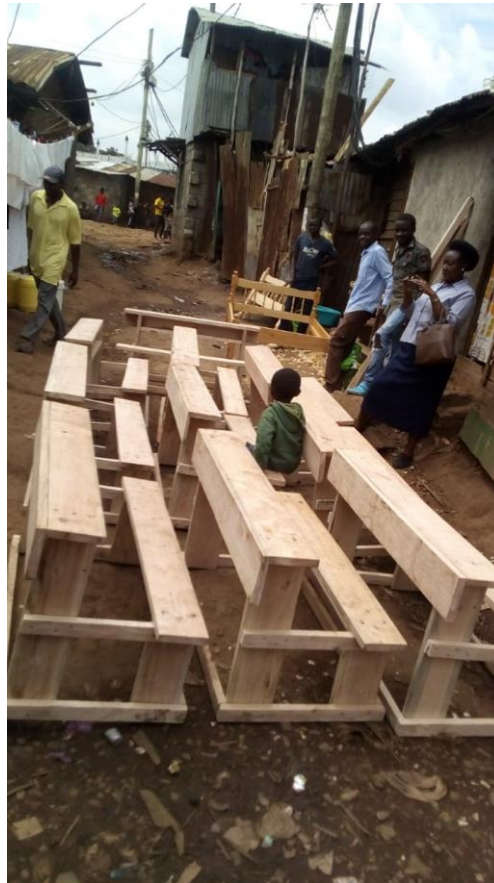
Tafels/banken in de maak voor de drie lagere scholen

De Akili School wordt o.a. structureel gesteund door www.thelotterycentre.com een internationale loterij- verkooporganisatie