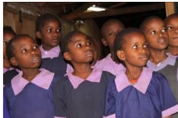
Kinderen op de Akili School

De Akili School wordt o.a. structureel gesteund door www.thelotterycentre.com een internationale loterij- verkooporganisatie