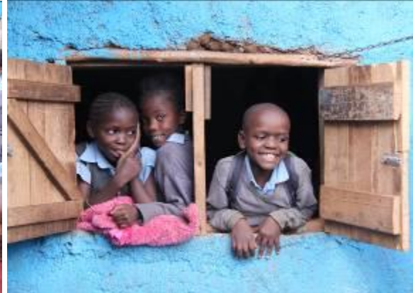
Blijde gezichten op Aim Higher

De Aim Higher School wordt structureel gesteund door ALLSAFE Mini Opslag.