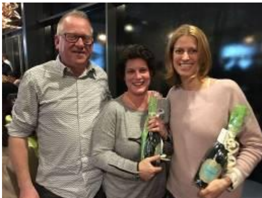
De winnaars van de Pubquiz 2018

Ruim 100 deelnemers hebben hun kennis van muziek, film en media getest op deze gezellige avond. De loten voor de loterij werden goed door de deelnemers gekocht. Mede door de prachtige prijzen die door sponsoren ter beschikking waren gesteld. Hierdoor had deze avond de mooie opbrengst van € 2.427,-