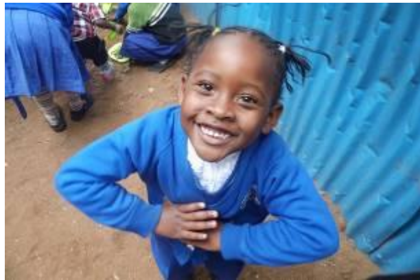
Kinderen op Jukumu Letu

Jukumu Letu wordt structureel gesteund door Sauna Beauty & Wellness de Heuvelrug uit Veenendaal. Met deze steun hebben alle kinderen tussen de middag een voedzame lunch.