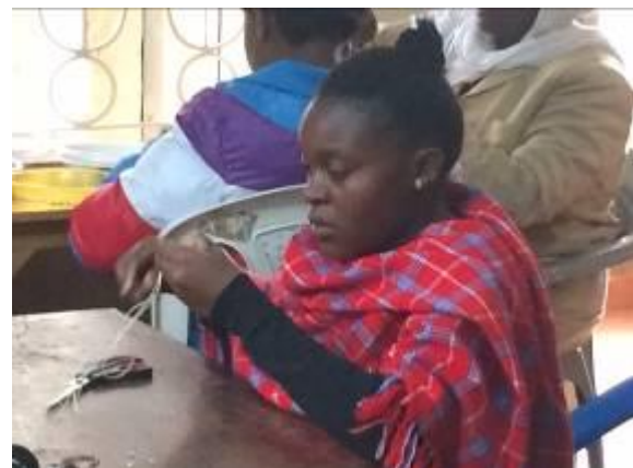
Dames aan het werk voor order Unilever/Etos